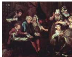
Tom Rakewell já está preso, e mesmo no cárcere seus companheiros tentam tomar seu dinheiro. As imagens pertencem a uma sequência pintada pelo inglês William Hogarth entre 1732 e 1733, apresentando o caminho de um irresponsável rumo à desgraça; em duas etapas, o pintor representa o perigo da dívida