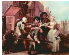
O personagem Tom Rakewell escapa por pouco à prisão por falta de pagamento

A escritora canadense Margaret Atwood foi considerada visionária em 2008. A crise de Wall Street, disparada pelo escândalo dos "subprimes" e a quebra do banco Lehman Brothers, acabara de estourar quando ela lançou o livro "Payback: A Dívida e o Lado Sombrio da Riqueza" (publicado no Brasil pela Rocco em 2009). Com base em palestras para a rádio canadense, proferidas em 2007, a escritora expunha seu estranhamento diante de uma sociedade fundada sobre o endividamento irresponsável dos cartões de crédito e das hipotecas, que resultaria em desastre, primeiro nos EUA, depois na Europa.