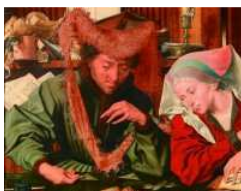
Na versão de Marinus van Reymerswaele para "O Banqueiro e sua Mulher" (1539), a representação do financista é positiva

emprestares dinheiro ao meu povo, não te haverás com ele como credor; não lhe imporás juros". No final das Cruzadas, diz Hudson, a Europa foi inundada com ouro e prata trazidos do Oriente Médio e, mais tarde, da América, impulsionando o comércio e, por extensão, as finanças. A partir desse momento, os teólogos espanhóis da escola de Salamanca encontraram meios de valorizar os empréstimos e a cobrança de juros.