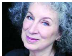
O livro da escritora canadense Margaret Atwood sobre dívida foi transformado em filme, que estreou no Festival de Sundance

Para Lazzarato, a relação por trás do endividamento é uma relação política fundamental, não simplesmente um dispositivo econômico, mas uma "técnica de governo e de controle das subjetividades", que torna o tempo mais previsível e organiza comportamentos. "O paradigma do social não é dado pela troca, seja econômica ou simbólica, mas pelo crédito. Na base da relação social não está a igualdade da troca, mas a assimetria entre crédito e dívida, que precede a produção e o trabalho assalariado, tanto histórica quanto teoricamente".